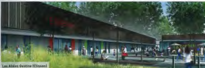
Les Allées Gestina (Clisson)

(Ruaudin-Lé Mans) Altarea Un Family Village combiné à un centre commercial, telle est la formule gagnante proposée au sud du Mans, où Altarea développe une galerie marchande couverte de 35 000 m 2 Shon, qui sera accolée au Family Village déjà existant de 28 830 m 2 Shon. Soit une offre commerciale régionale de 63 830 m 2 Shon. Le cabinet d'architectes retenu se nomme Groupe 6. Au programme : un hypermarché Auchan, Gémo, Chaussée, Acuits, GrandOptical, Formul, Bleu Libellule, Shampoo, Jean-Louis David... A noter que ce centre est situé à proximité de deux équipements accueillant de grands événements sportifs : le stade MMArena et la salle Antarès. Date de livraison : 2 e semestre 2013.