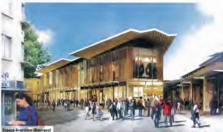
Espace Avaricum (Bourges)