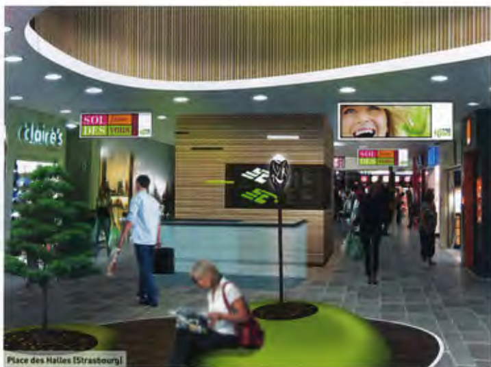
Place des Halles (Strasbourg)

Rénovation du vieux centre de la place des Halles par le cabinet d'architecte Minale Design Strategy. Un projet de grande ampleur puisqu'il concerne un établissement de 41 000 m 2 occupé par quelque 120 boutiques. Fin des travaux en 2013.