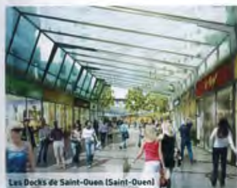
Les Docks de Saint-Ouen (Saint-Ouen)

(Saint-Mard) Groupe Desjouis Création d'un retail park de 53 000 m 2 Shon architecturé par Outsign. Ouverture prévue pour 2014.