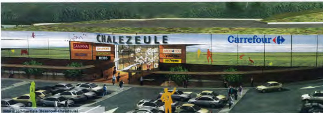
Galerie commerciale (Besançon-Chalezeule)