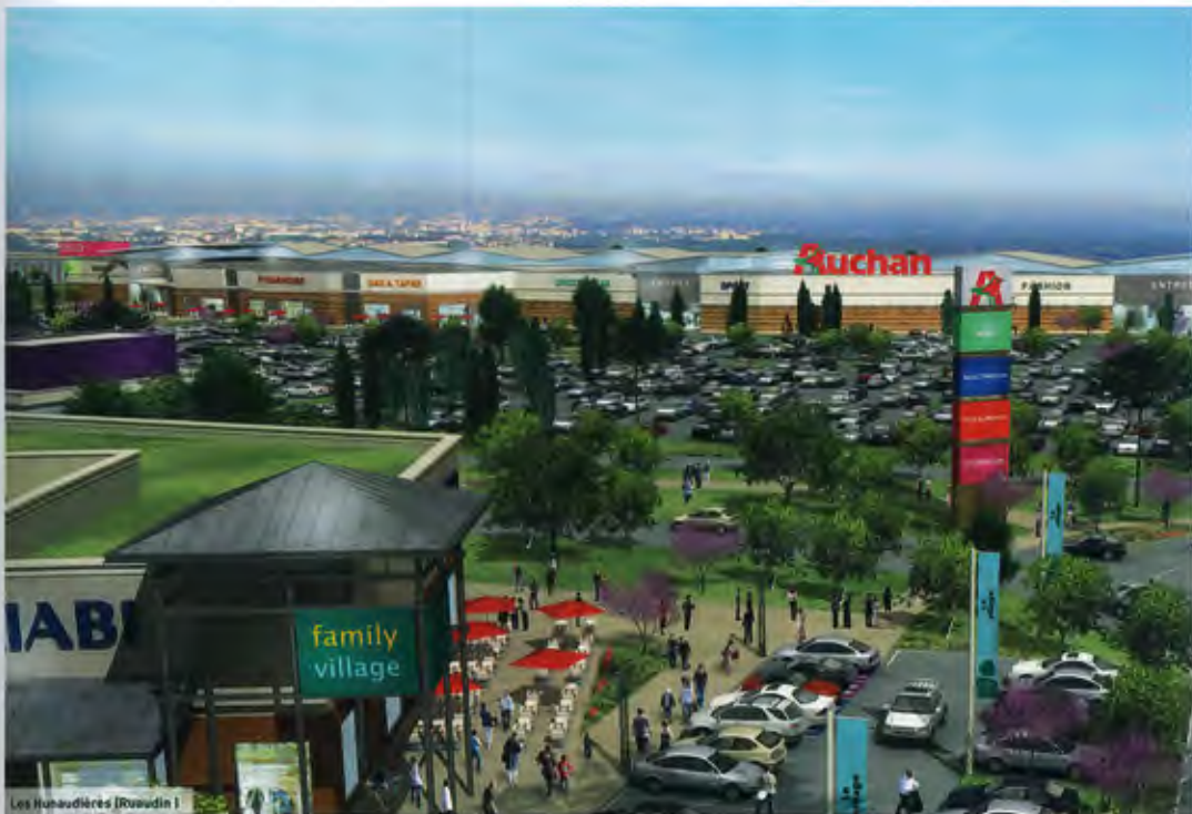
Les Huaudières (Ruaudin)