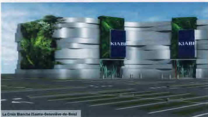
La Croix Blanche (Sainte-Geneviève-des-Bois)