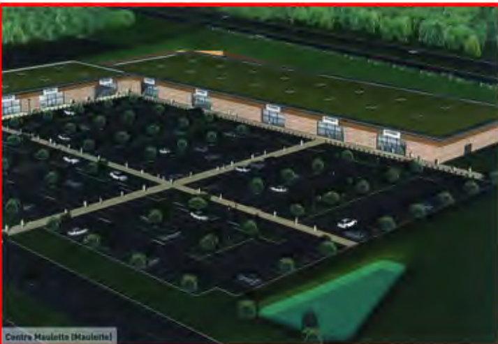
Centre Maulette (Maulette)

(Sartrouville) CS Invest Restructuration par Jean Perrimond (cabinet Archis 54) de l'ancien site de Castorama sur une surface de 5 500 m 2 . Une demi-douzaine de cellules seront commercialisées par Eol. Livraison prévisionnelle : 4 e trimestre 2013.