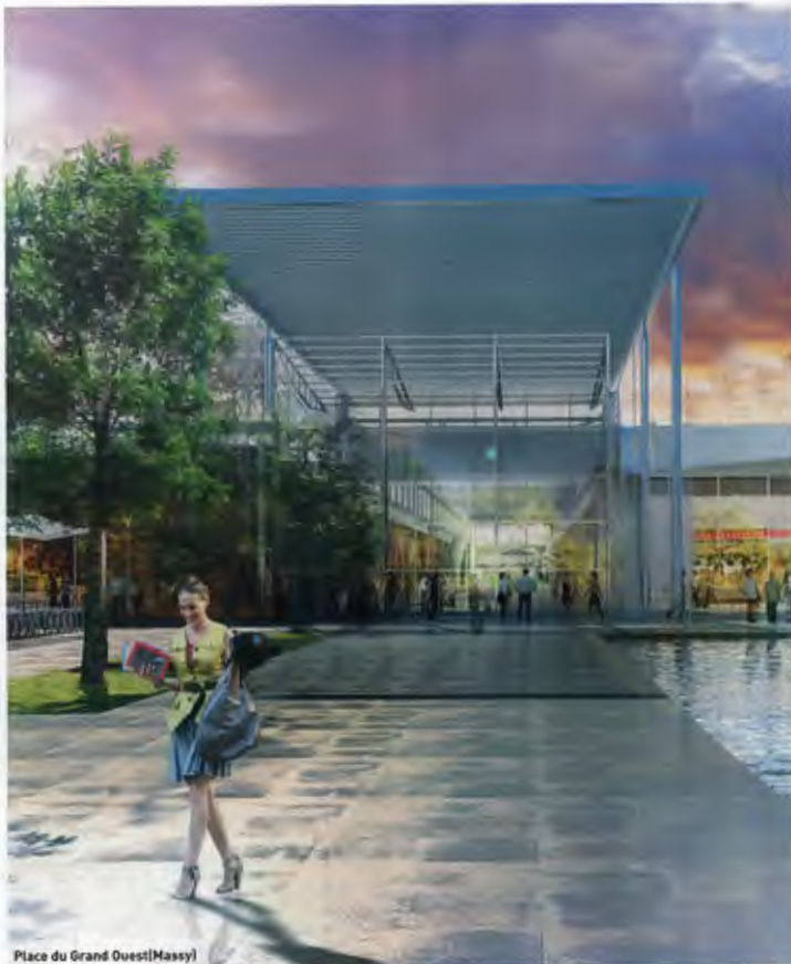
Place du Grand Ouest(Massy)

Extension de 6 600 m 2 Gta et rénovation du centre commercial de Massy. L'agrandissement portera la surface globale du centre à 25 000 m 2 de surface de vente pour passer de 60 à 80 boutiques, restaurants et moyennes surfaces, attenants à un hypermarché appartenant au distributeur Cora. Le projet s'intègre dans un site majeur de 70 000 m 2 , avec un positionnement mainstream et un projet architectural confié à Jean-Paul Viguier. Ce centre commercial se fonde dans un quartier en cours de réhabilitation qui compte déjà de nombreux sièges sociaux de grands groupes comme Carrefour, Safran, Sagem, Sanofi... La fin de ce grand chantier est programmé pour 2014.