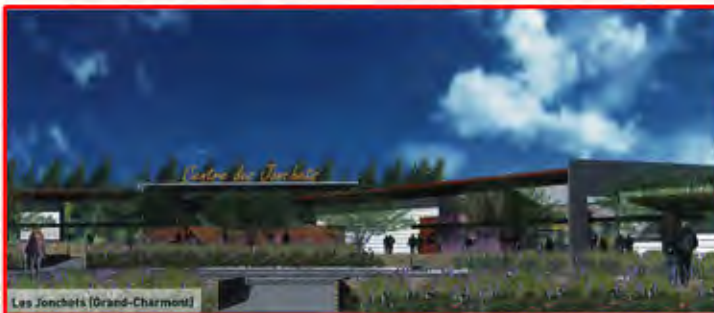
Les Jonchets (Grand-Charmont)