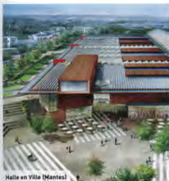
Halle en Ville (Mantes)