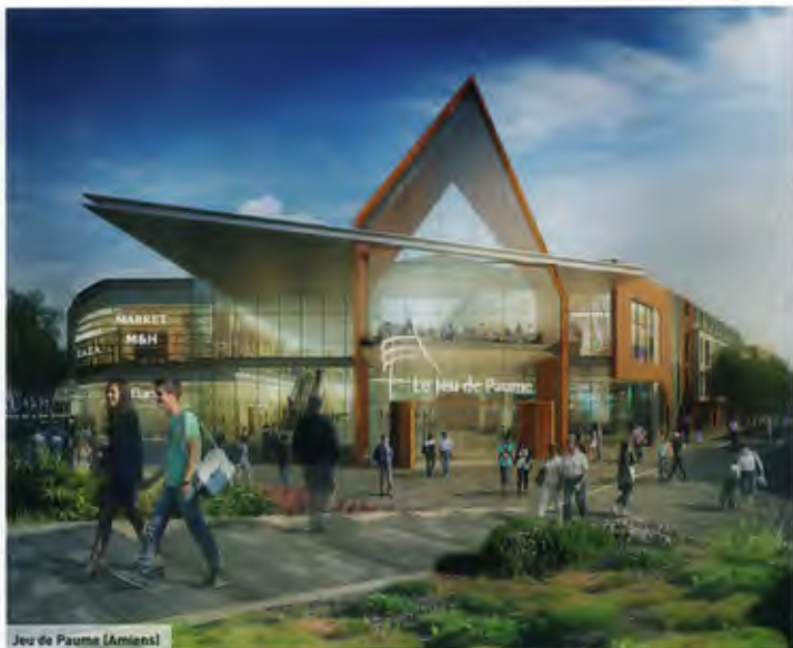
Jeu de Paume (Amiens)

Apparition d'un nouveau cœur de commerce dans la zone de Creil-Saint-Maximin en lieu et place de l'ancien Castorama. Le nouvel équipement commercial s'étendra sur 9 236 m 2 de surface de vente. Livraison prévue en septembre 2013.