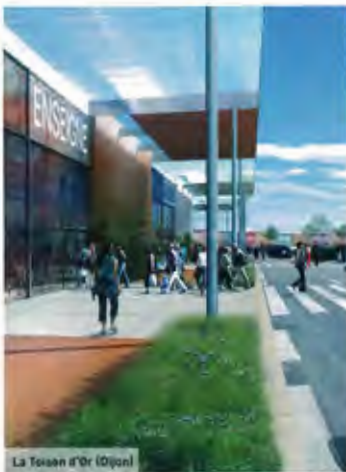
La Toison d'Or (Dijon)

Le centre commercial de la Toison-d'Or, à Dijon, va être entièrement rénové et étendu 12 000 m 2 de surface commerciale. Côté design, de grandes verrières, un sol en pierre de Bourgogne et des garde-corps transparents sont programmés. Livraison prévue en octobre 2013.