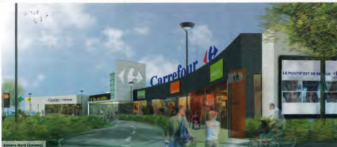
Amiens Nord (Amiens)

Situé rue des Girondins, ce bâtiment constitué de 2 cellules aux enseignes Isambourg et Easy Cash, d'une surface de 1 112 m 2 Gta, a bien choisi son lieu d'implantation. Il est en effet installé à côté du bâtiment intégrant Grand Frais et Biostore, ouverts au printemps 2010. Livraison prévue fin 2012.