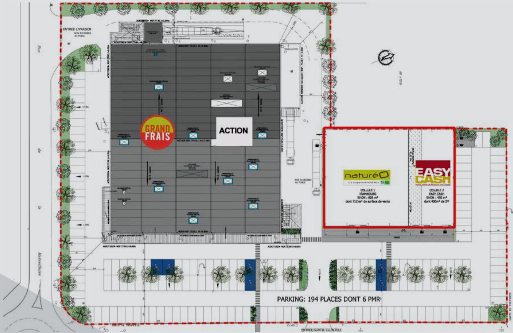
Cabinet d'architecture BOUTET-DESFORGES