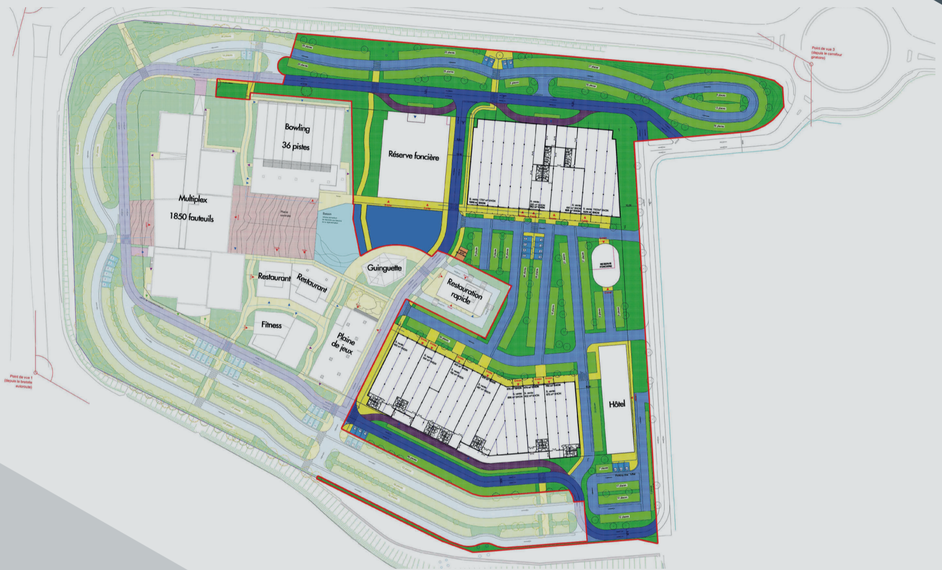
Plans indicatifs non contractuels Cabinet d'architecture H2A