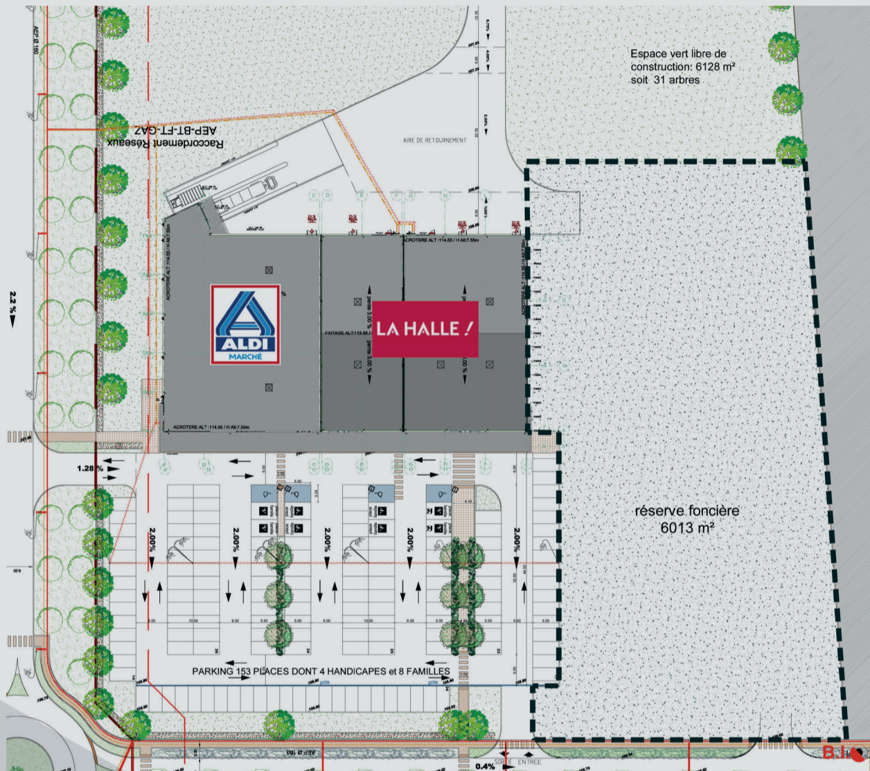
Cabinet d'architecture BOUTET-DESFORGES