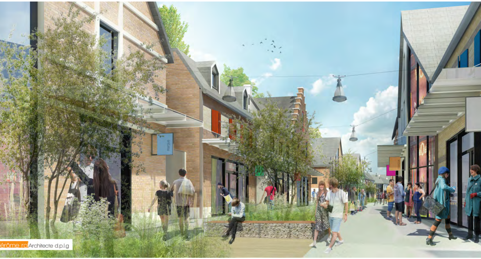
Jérôme rol Architecte d.p.l.g