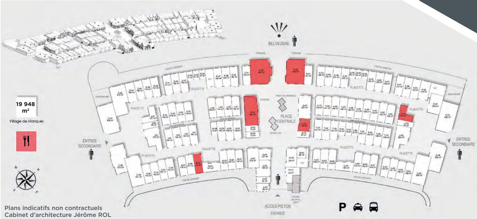
Plans indicatifs non contractuels Cabinet d'architecture Jérôme ROL