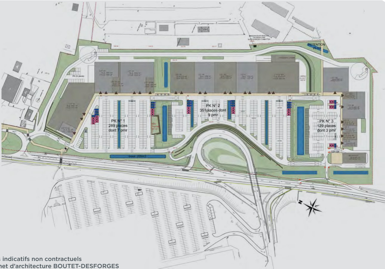
Plans indicatifs non contractuels Cabinet d'architecture BOUTET-DESFORGES