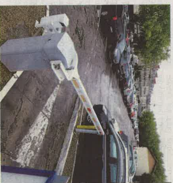
La zone de stationnement à péage sera transférée sur la partie gratuite de Tourny.

PÉRIGUEUX L'aménagement d'une galerie commerciale à la place du parking est diversement apprécié par les habitants et les commerçants. Page 15