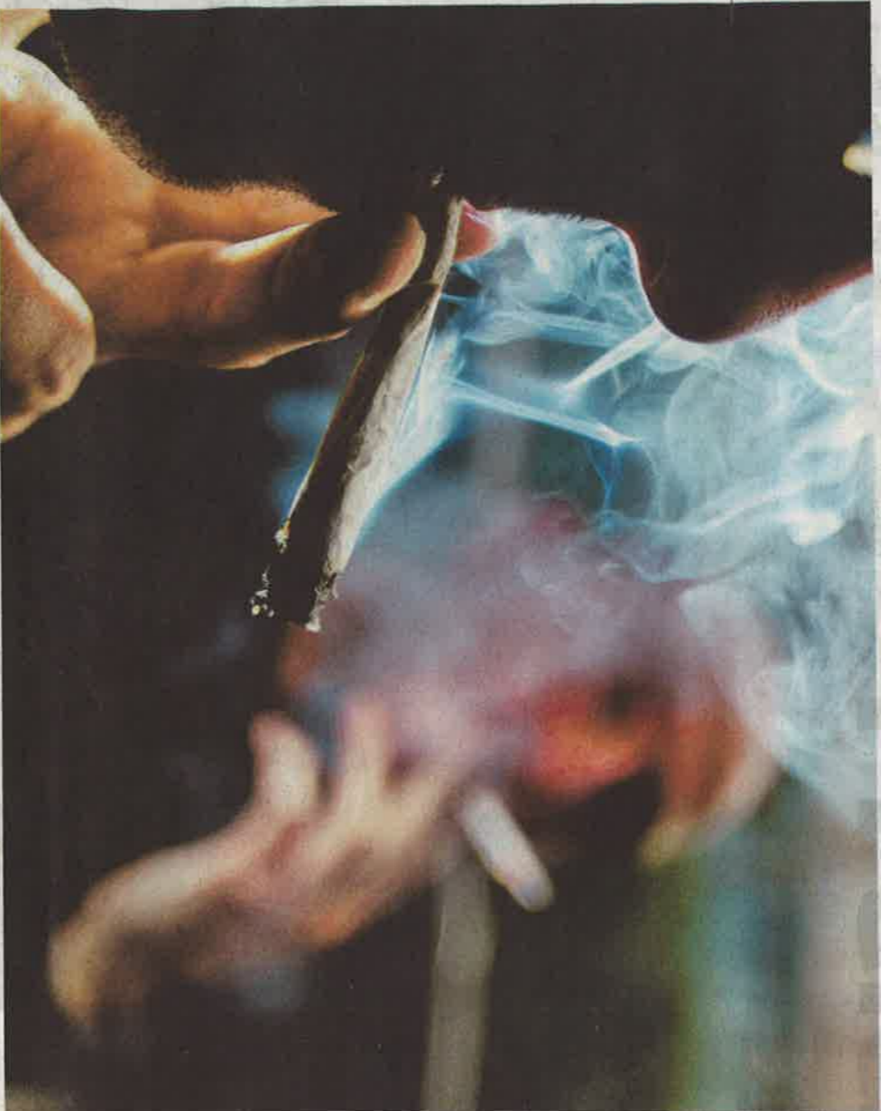
1,4 million de Français fument au moins 10 joints par mois. En France, consommer du cannabis est possible d'une peine de prison et de 3 750 euros d'amende.