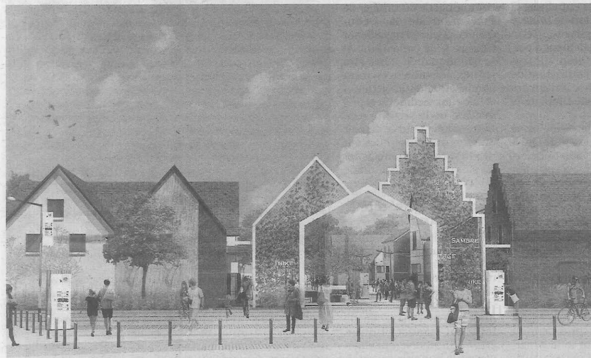
Les constructions seront d'inspiration nordistes

Ouverture du nouvel ensemble commercial L'Escale.